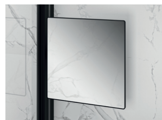
Select+ Mirror Beweglicher Spiegel