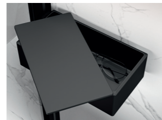
Select+ Drybox Aufbewahrung und Schutz vor Schaum und Spritzwasser