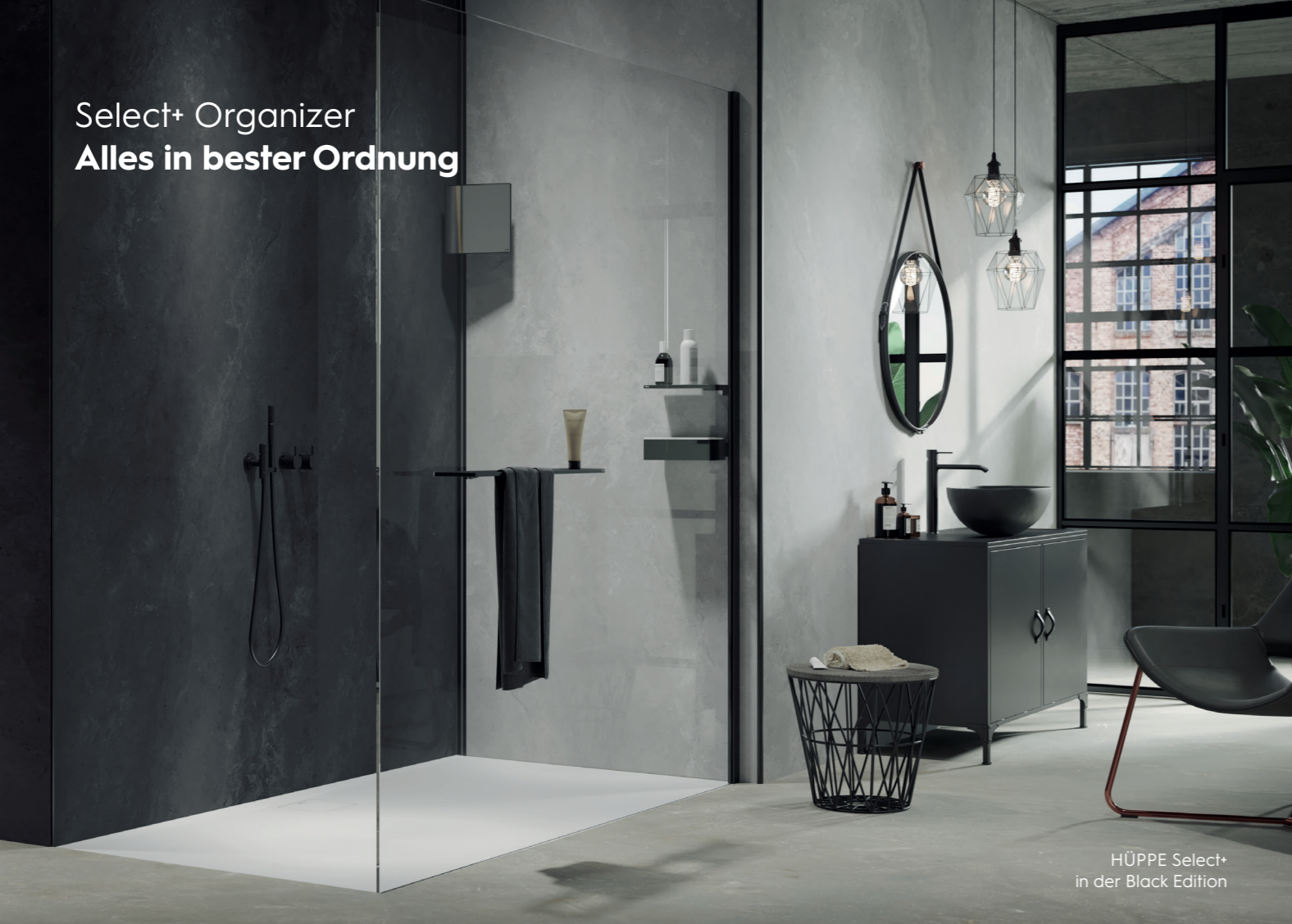
HÜPPE Select+ in der Black Edition

Die vielseitigen Accessoires von HÜPPE Select+ sind ein echtes Plus für Ihren Duschkomfort und setzen starke optische Akzente. Sie überzeugen funktional durch eine einfache Montage ohne Bohren, höchste Flexibilität und eine leichte Reinigung.