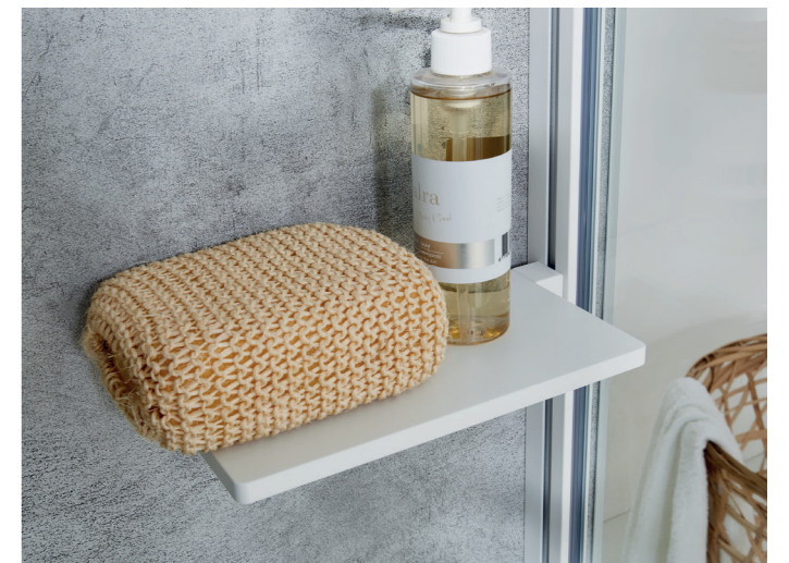
Ein echter Hingucker - HÜPPE Select+ in der White Edition