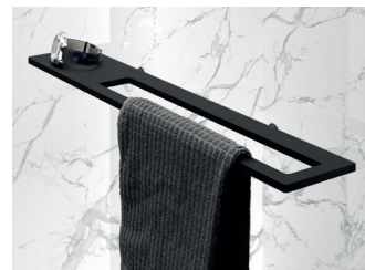
Select+ Shelf 2 in 1 Handtuchhalter und Ablage - innen, flächenbündig

Die vielseitigen Accessoires von HÜPPE Select+ sind ein echtes Plus für Ihren Duschkomfort und setzen starke optische Akzente. Sie überzeugen funktional durch eine einfache Montage ohne Bohren, höchste Flexibilität und eine leichte Reinigung.