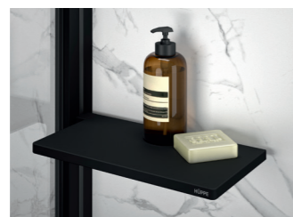
Select+ Tablet Designablage