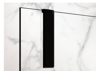
Select+ Wiper Handwischer