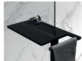
Select+ Shower Board 2 in 1 Handtuchhalter und Ablage - universell nachrüstbar für alle alleinstehenden Seitenwände mit 6/8 mm Glasstärke