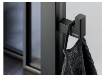
Select+ Hook Aufhänger, stufenlos höhenverstellbar