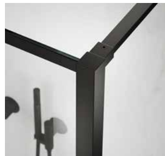
Querverstrebung über die Abschlussleiste

Schwarz steht für Industriekultur und starke Kontraste. Der kraftvolle Wohnstyle ist im Bad angekommen.