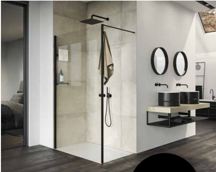
Select+ Klar Black Edition

Inspiziert vom aktuellen Industrie-Look, der mit seinen markanten Merkmalen einen herben Charme versprüht, verleiht HÜPPE mit dem Design der Walk-In Select+ Frame einen kraftvollen Auftritt. Bei der Black Edition sind sämtliche Bauteile der Duschkabinen in sattem Schwarz matt lackiert.