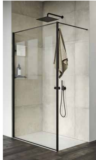
Select+ Frame Black Edition