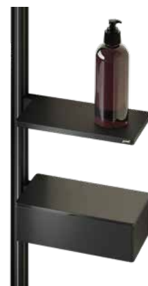
Select+ Shelf box black

Die Walk-In Select+ Frame bietet eine große Flexibilität, Select+ Accessoires anzubringen. Sowohl die Wandleiste als auch das Abschlussprofil besitzen einen Select+ Kanal. Die dezente Querverstrebung geht direkt in die Abschlussleiste über. Damit ist die Stabilisierung elegant gelöst – Select+ Frame ist in 6mm Glas sowie in den Farben Black Edition und Silber matt erhältlich.