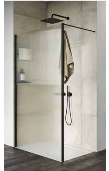
Select+ Vintage Black Edition